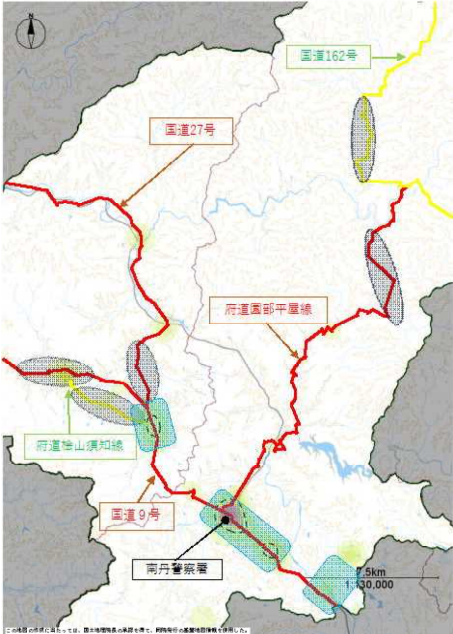
【平成31年～令和3年の交通事故発生状況】

交通事故多発区域のほか、同区域に流入する路線でも速度取締りを実施することで、交通事故抑止に努めます。