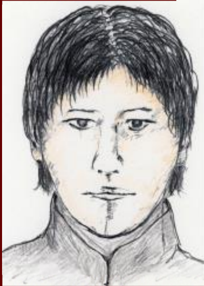
当時年齢20～30歳（現在30～40歳代）