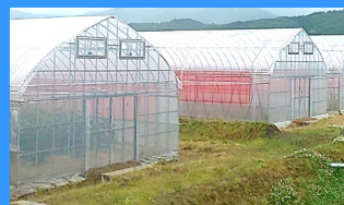
高付加価値農業施設の設置