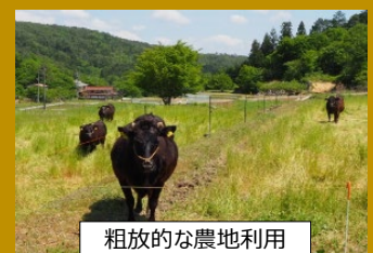
粗放的な農地利用