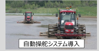
自動操舵システム導入