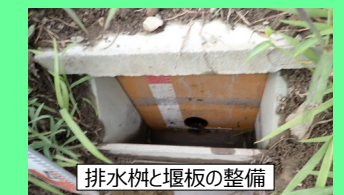
排水柵と堰板の整備

(ソフト) 「田んぼダム」実施に向けた地元調査・調整経費、堰板購入等 (単年度当たり300万円迄)、条件改善促進支援 (定率) 等