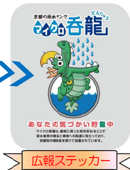
※雨水タンクを設置いただいた方に配布