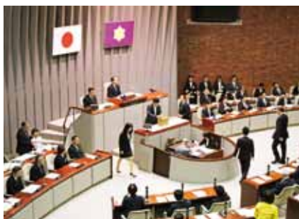
議長・副議長選挙の投票の様子

常任委員会 の名称や委 員定数、所管 事項、特別委 員会の設置 など議会の 新しい構成 を決定しま した。