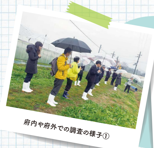
府内や府外での調査の様子①

見交換などの広聴活動も行っています。実際に現場の様子を把握するとともに、先進的な取り組みを見