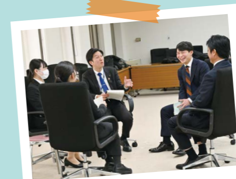
大学生と議員の座談会