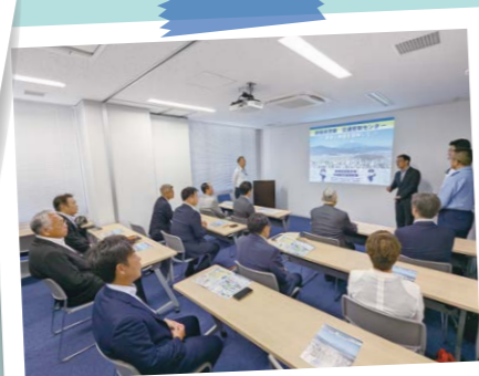
府内や府外での調査の様子②