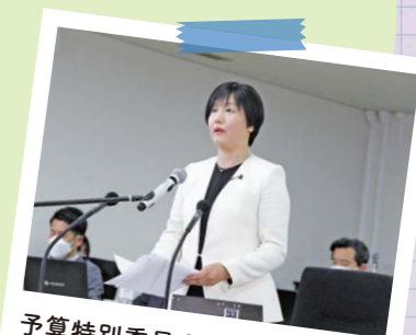
予算特別委員会総括質疑の様子

次年度予算の審議や前年度決算の認定を通じて、事業が適正に行われているかを確認します。