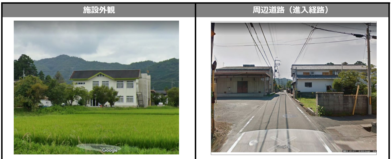
Google ストリートビュー