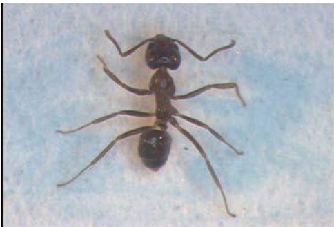
写真2：アルゼンチンアリ背面からの写真