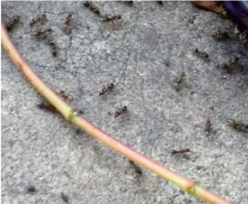
写真1：コンクリートを這うアルゼンチンアリ