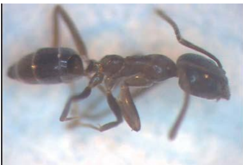
写真3：アルゼンチンアリ側面の写真

農作物や植物などが被害を受けることがあります。また直接、果樹などの農作物に影響を与える場合があります。