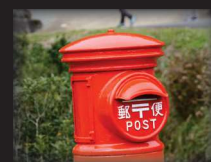
レトロ郵便ポスト

広々とした車内の路線バスでのんびりと快適に。 「もうひとつの京都周遊バス」を使って出かけませんか。 第3弾は、南丹市の美山散策コースと愛宕山トレッキングコース、 1枚のバスで2日間も満喫できます。