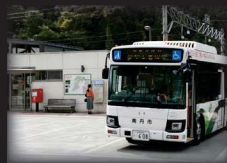
南丹市営バス (日吉駅)