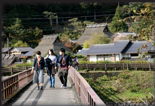
かやぶきの里散策

※土曜ダイヤでのタイムスケジュールです。日祝ダイヤは下段 ( ) となっております。