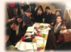
お茶会・交流会のようす