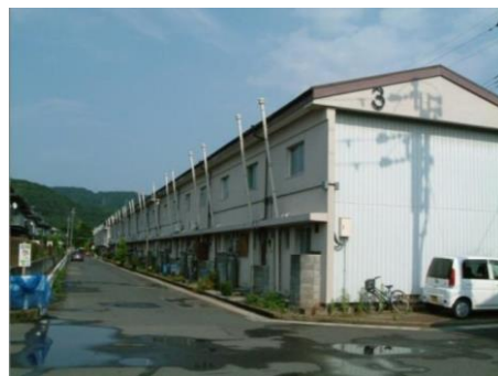
【簡易耐火2階建タイプ】