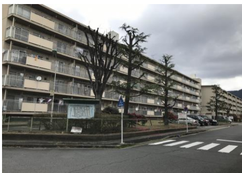
【中層耐火タイプ(3～5階)】

概ね2年以上の長期間応募がない空き住戸等 52 団地 726 戸 (EV なし住戸:531 戸) R4.3 月末時点 ※団地入居者の日常生活に支障がないこと、団地自治会と事前協議することなどを活用要件としています。