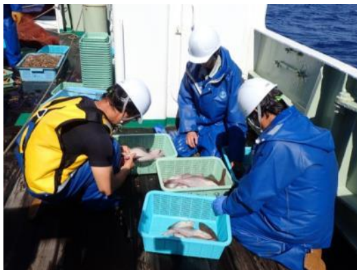
アカガレイの選別作業