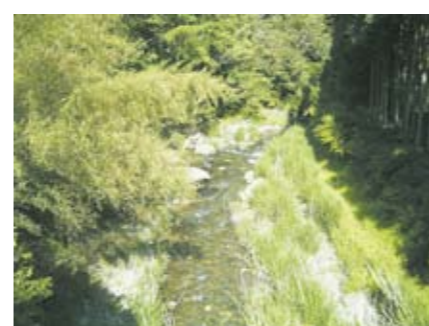
上流の様子(雲ヶ畑)

また、その流域の約70%を山地が占め、残りの約30%は、鴨川などの河川のはん濫によってつくられた せんじょうち 扇状地です。この扇状地に しがいち 京都の市街地が広がっています。