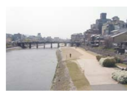
中流の様子(三条大橋付近)