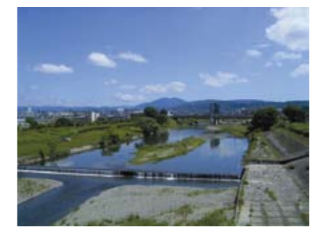
下流の様子(大宮大橋付近)