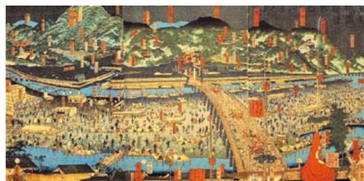
江戸時代の四条河原の様子

鴨川は、都の中にあって貴重な広い空間であったため、芝居小屋や見世物小屋、茶店などが建ち並び、多くの人々が河原に集まるようになりしました。