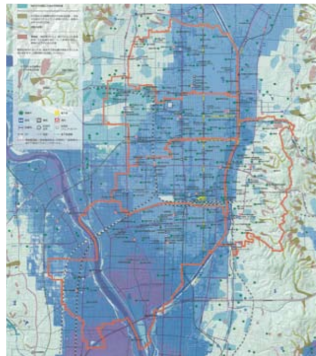
京都市防災マップ