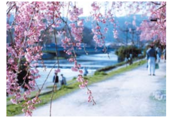
半木(なからぎ)の道(春)