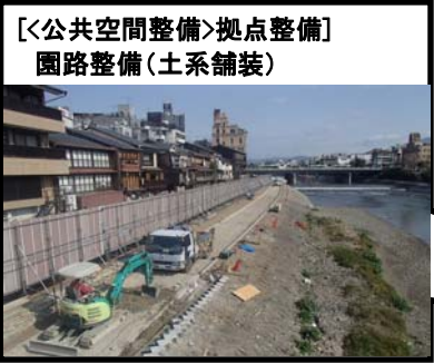
(四条大橋下流右岸)