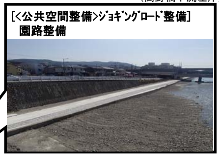
(塩小路橋下流左岸)