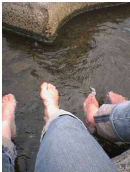
コメント：三角州の近くの飛び石に座った所から撮影しました。冷たい鴨川の水が気持ち良かったです。いつまでも、触りたい・入りたいキレイな鴨川であって欲しいです。