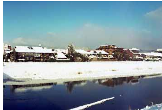
撮影地：山紫水明の地 丸太町橋から