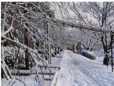
撮影地：半木の道 北山大橋東岸下流 コメント：鴨川の写真3点投稿します。いずれも冬の風景で、デジタルで「水彩画」処理をしています。原版ではありません。