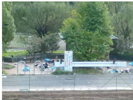
撮影地：鴨川上流（柵野ダム上の公園） コメント：《改善すべき箇所、迷惑行為、鴨川への思い》

鴨川上流（柵野ダム上の公園）は一日中、バーベキュー客で大賑わい、深夜まで花火が続き。。。周辺住民は、連日騒音に悩まされています。