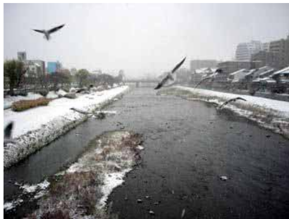
撮影地：団栗橋から四条大橋を望む