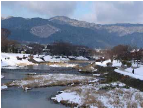
撮影地：鴨川と船山 御園橋のバスの中から