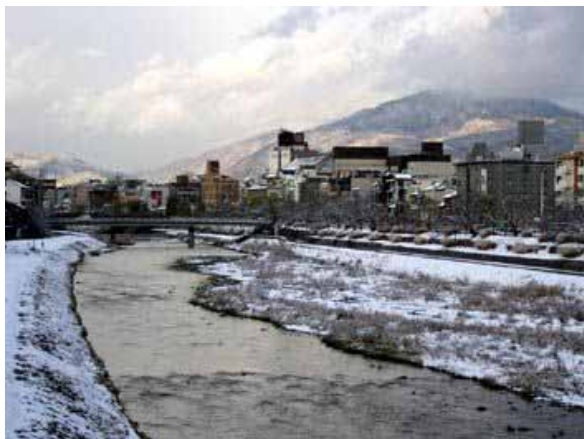
撮影地：松原橋から下流側