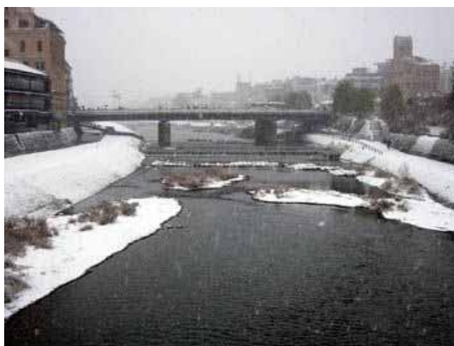
撮影地：松原橋と団栗橋の間から比叡山方向を望む

コメント：北山、比叡山と鴨川の雪景色。普段の雪ならば午前中で解けるのですが、豪雪でした。