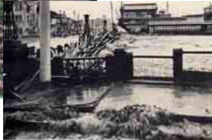
昭和10年出水: 四条大橋付近