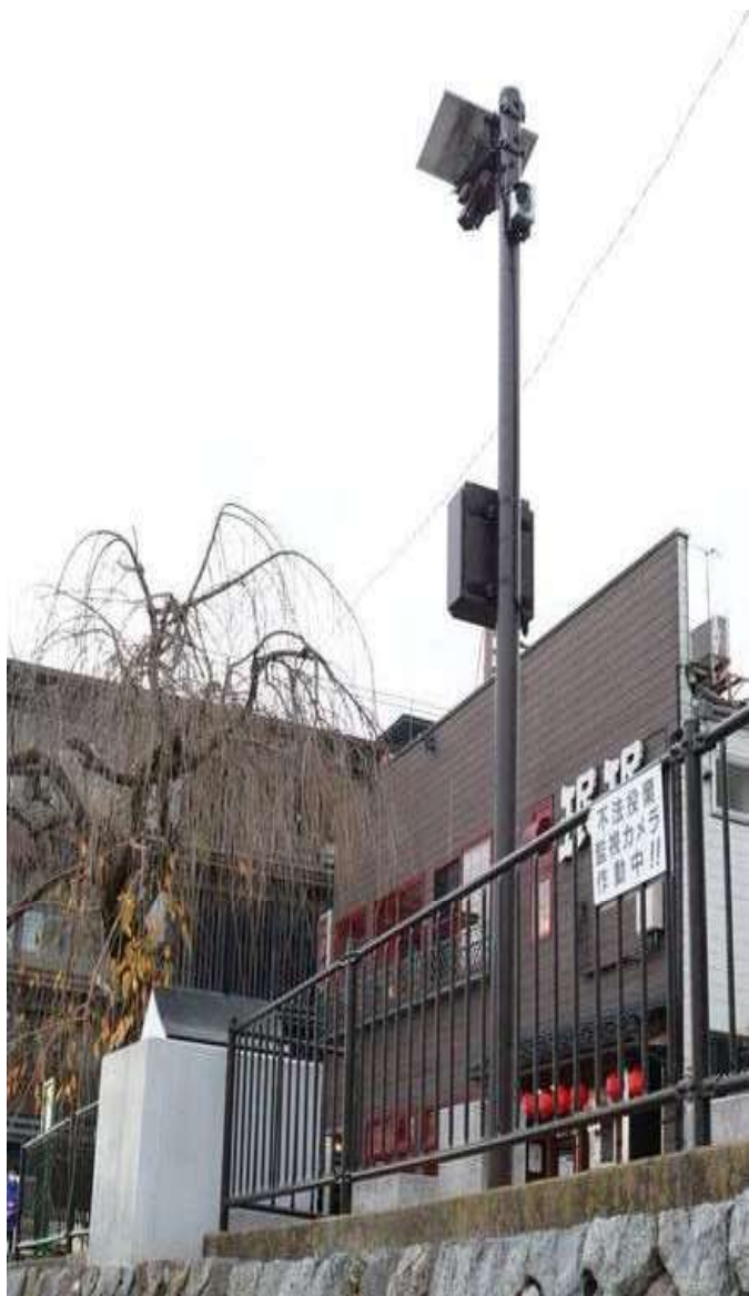
不法投棄監視カメラ