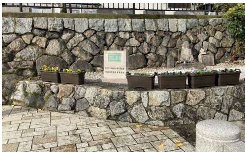
再設置されたプランター（アンカー付き）