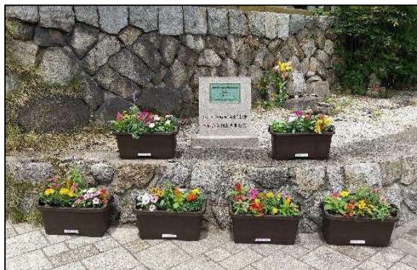
6月設置当時のプランター

個人の美化意識に訴えられるよう、美しい花を入れたプランター6個を試験的に仮置したもの。花は先斗町まちづくり協議会及び京都鴨川納涼床協同組合が維持管理。