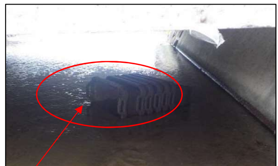
投げ捨てられたプランター