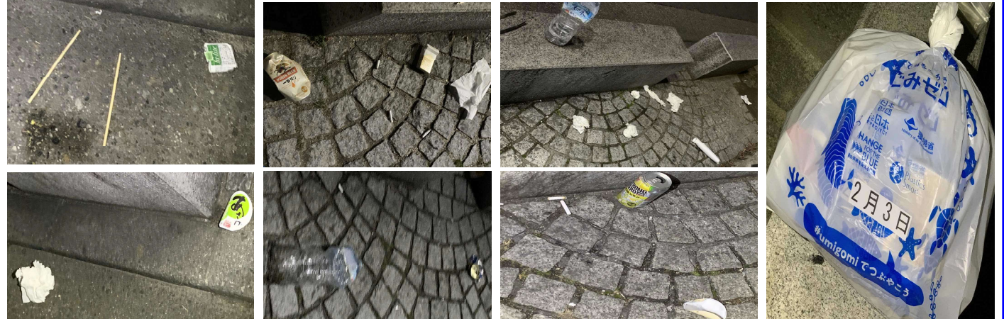
2月3日(金)午前3時～清掃開始プランター前にゴミ有