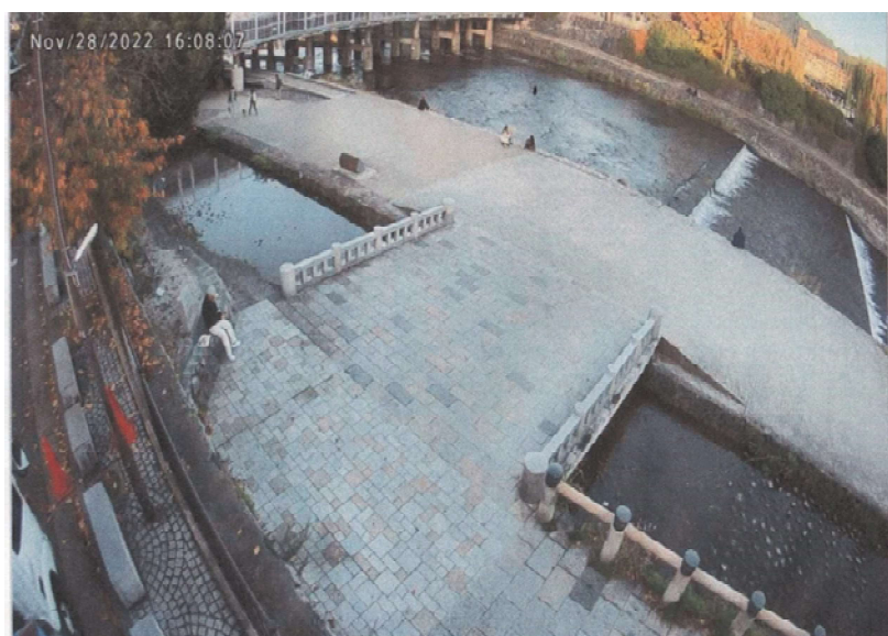
監視カメラによる想定監視エリア