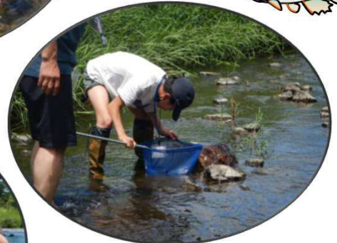
石の下にいるかな？

確認された生き物 ヘビトンボ、カワニナ類、 コオニヤンマ、ザリガニ、 ヒゲナガカワトビケラなど