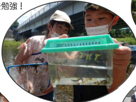
たくさんとれたよ！

確認された生き物 ヘビトンボ、カワニナ類、 コオニヤンマ、ザリガニ、 ヒゲナガカワトビケラなど