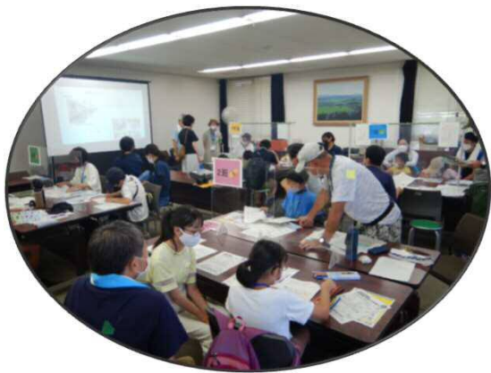
ぬりえで生きものの特徴を勉強！