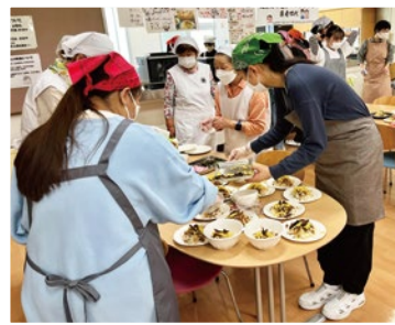
食生活改善推進事業