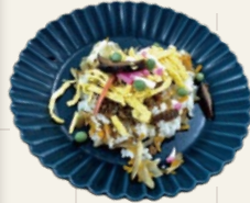
丹後の郷土料理 ばら寿し調理講習