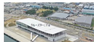
金沢港クルーズターミナル