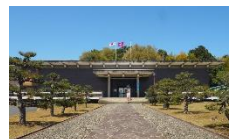
京都府立丹後郷土資料館