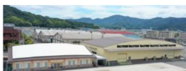
京都舞鶴港旅客ターミナル うみとびら