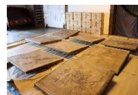
文化財の修復 (京都府宮津市 智源寺の天井画)