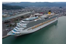
クルーズ船「コスタ・セレーナ」 (R5.10京都舞鶴港にて)