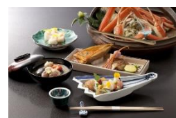
加賀料理