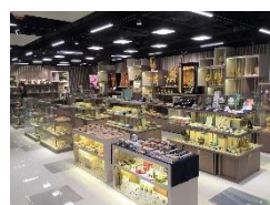
プロモーション会場イメージ