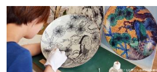
訓練の様子 (石川県立九谷焼技術研修所)