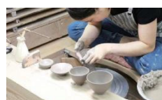
訓練の様子 (京都府立陶工高等技術専門校)