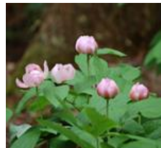
写真3-2-3 ベニバナヤマシャクヤク

内久保では地域住民と保全団体により、生育環境の整備や盗掘対策、人工繁殖などが行われた結果、個体数が飛躍的に増加し、全国屈指の群生地となりました。観察会も行われ、ベニバナヤマシャクヤクを観光資源として活用し、里山の魅力の周知や地域振興につなげる取組も進められています。