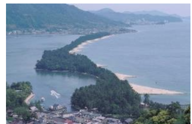
丹後天橋立大江山国定公園