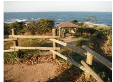
写真3-2-6 山陰海岸国立公園

概要：我が国の風景を代表するに足りる傑出した自然の風景地（海域の景観地を含む）であって、環境大臣が関係都道府県及び中央環境審議会の意見を聴き、区域を定めて指定。公園利用施設の整備、管理や行為許可事務、届出受理を行う公園管理者は環境大臣