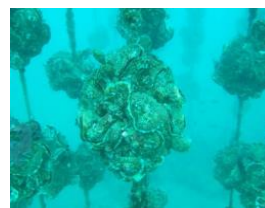
写真3-2-15 イワガキの養殖

また、河川においては、漁業協同組合が、魚が産卵しやすい環境づくり等を通じて魚類の保護増殖に努めているほか、水辺に降りる道の管理や駐車スペースの確保等、釣りを通じて府民が川の自然に親しむ環境整備を行っていることに加え、近年では地域住民等とも連携して魚類の遡上促進や生物多様性の保全に寄与する活動も行われており、これらの取組を支援しています。