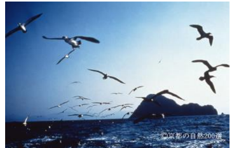
写真3-2-17 冠島とオオミズナギドリ

自然環境の保全について府民の関心を高めるため、府内に所在する優れた自然環境の中から選定。平成3年6月に植物部門50点を選定し、平成4年9月に動物部門45点、植物部門（植物群落）5点、平成5年8月に地形・地質部門46点、平成7年3月に歴史的な自然環境部門56点の4部門計202点を順次選定しました。