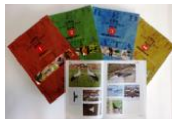
写真3-2-1 京都府レッドデータブック

府では府内における絶滅のおそれのある野生生物や保護を要する地形地質、学術上重要な自然生態系について、その現状や保全対策を複合的に把握し、府内の生物多様性を保全する施策の基礎的データとして活用するため、平成10年度から4年間かけて府レッドデータ調査を行い、平成14年6月に「京都府レッドデータブック」を発刊しました。その後10年余りが経過し、絶滅のおそれのある野生生物を取り巻く府内の環境も大きく変化したことから、平成25年度には野生生物編リストの改訂版を