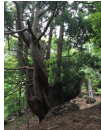
片波川源流域の伏条台杉