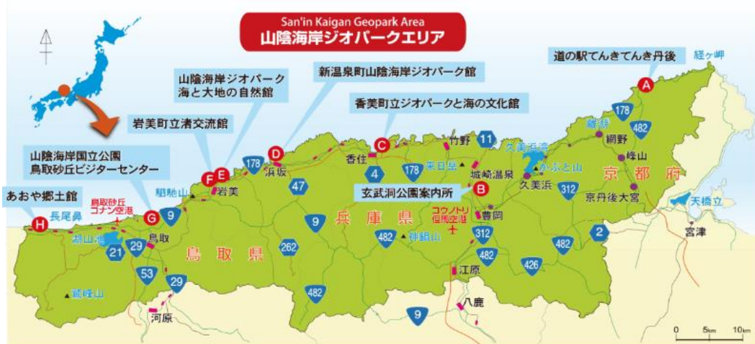
図3-2-1 山陰海岸ジオパークのエリア

府、兵庫県、鳥取県、京丹後市ほか関係市町等で組織した山陰海岸ジオパーク推進協議会と連携し、ジオサイトの整備、学術調査研究活動の充実等を進めるとともに、環境学習体験やジオガイドの養成、観光振興等の取組を進めています。