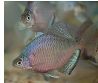
写真3-2-2 絶滅寸前種のイタセンパラ

また、アライグマやオオクチバス等による捕食や、チュウゴクオオサンショウウオと在来種との交雑等、外来種による影響も顕著になりました。一方で今回調査が進んだことにより、これまで府内では既に絶滅したと思われていた種の再発見や新たな生息地が発見された例もありました。