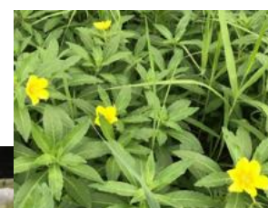
オオバナミズキンバイ