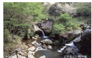
府立るり溪自然公園