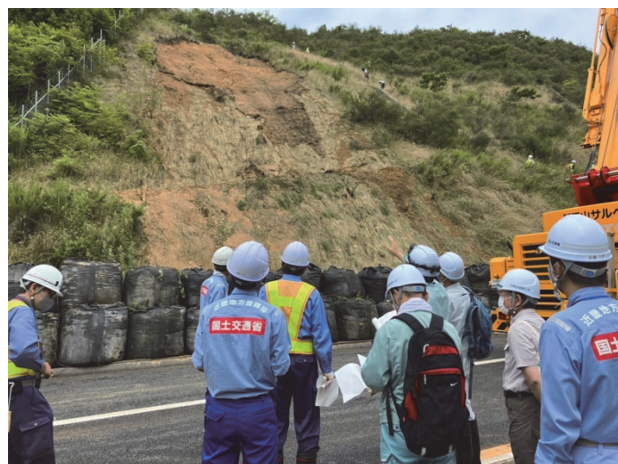
道路防災ドクター、国土交通省等による調査