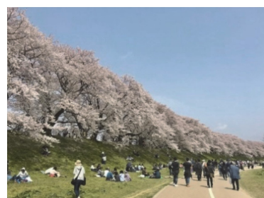
淀川河川公園（背割堤さくらまつり）