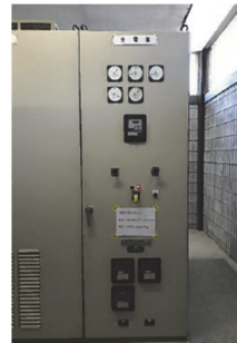
山城総合運動公園 受変電設備