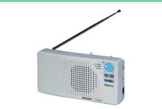
防災行政無線戸別受信機の 全戸貸与による災害情報の周知