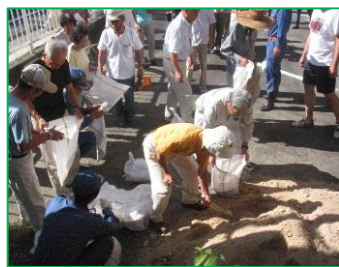
自主防災組織による 災害想定訓練

○気候変動の影響による災害の頻発化・激甚化に対応するため、平成16年台風23号と同規模の洪水に対して人家浸水被害の解消を図ることを目標に河川整備を実施している竹野川水系では、以下の事前防災対策の取り組みを実施していくことで、流域における浸水被害の軽減を図る。