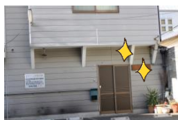
茶色の扉が目印です！