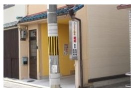
駐車場の入り口を抜けて……

住所：京都市中京区今新在家西町26-5 トロン温泉駐車場奥 ・阪急大宮駅から徒歩8分 ・JR二条駅から徒歩9分 ・市営地下鉄二条城前駅から徒歩10分