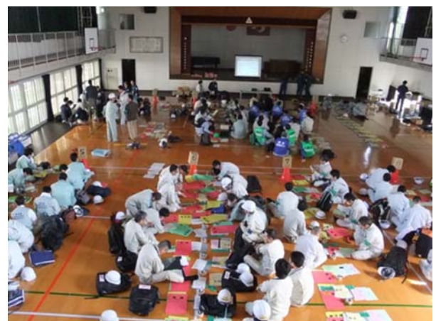
【写真：応急危険度判定拠点施設（県立盲学校体育館）】