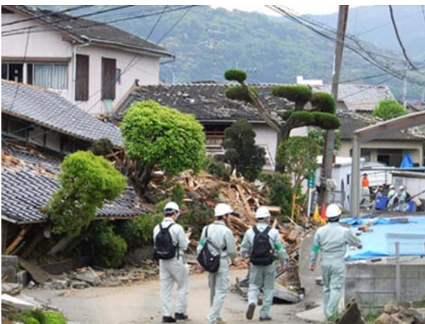
【写真：応急危険度判定活動（益城町）】

また、熊本市の場合、大量の判定士の移動が必要だったため、貸切バスを活用されていたが、決まった範囲に大量の判定士に乗り込んでもらう場合、非常に有効だったと感じました。