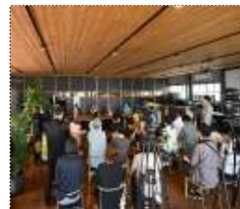
トークイベント「環境にやさしい食育」をテーマに発言する登壇者たち