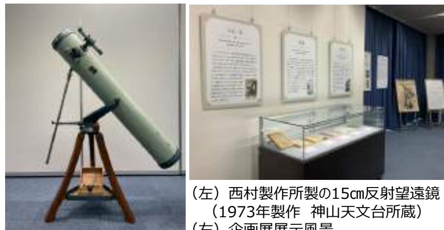
（左）西村製作所製の15cm反射望遠鏡 （1973年製作 神山天文台所蔵） （右）企画展展示風景