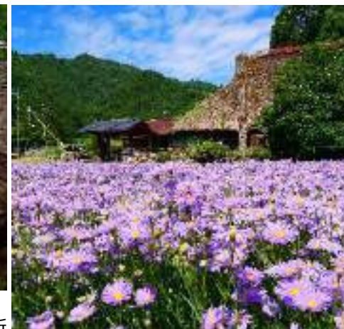
左京区久多の北山友禅菊（8月上旬）