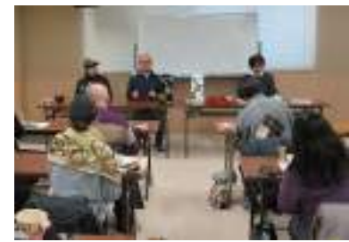
（参考写真：過去の実施状況）