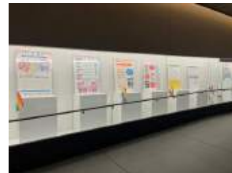
本庁舎地下連絡通路