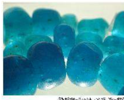
京都府立丹波博物館蔵 丹波ガラス製品