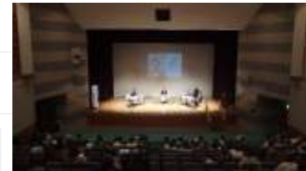
俳句大会（令和6年度の様子）

http://kozan-bunko.sakura.ne.jp/haikuprize.html