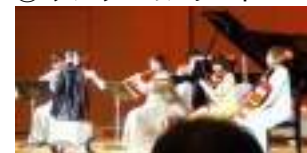
③ 五重奏の指揮をするアバター