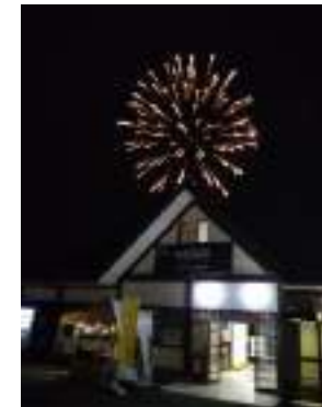
ガーデンフェスでは打ち上げ花火も