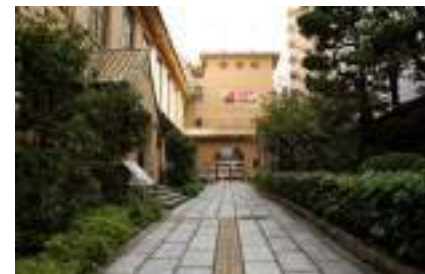
京都芸術センター