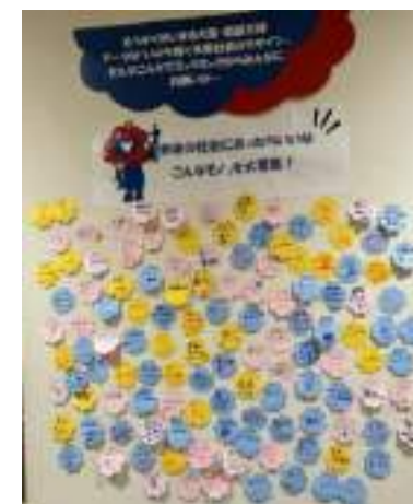
※ ロビー企画の写真