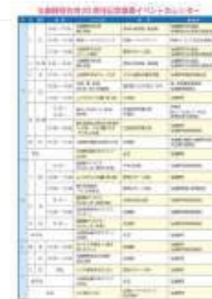
一体的広報を実施