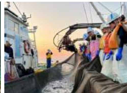
未来会議（探究プロジェクト）