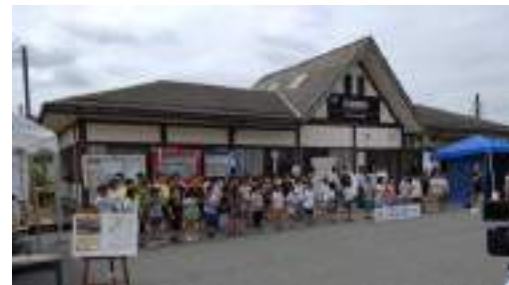
与謝野駅100周年記念式典 （地元小学校児童による合唱）