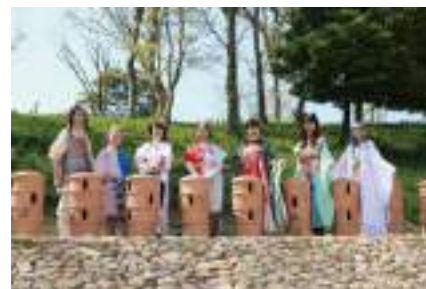
網野銚子山古墳史跡整備完了記念イベント

https://www.city.kyotango.lg.jp/top/soshiki/kyoikuinakai/syogaigakusyu/7/kyotangoartfes/index.html