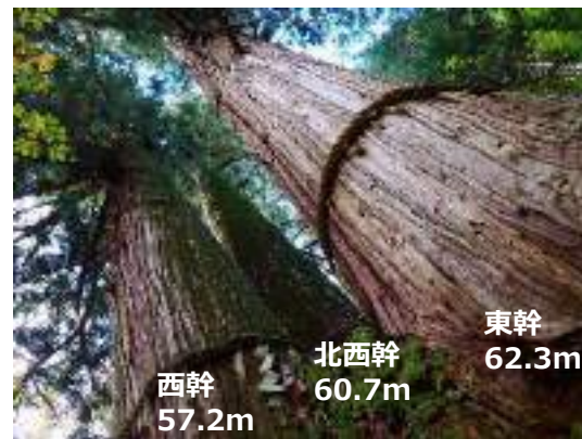
左京区花脊原地町 大悲山国有林 花脊の三本杉 林野庁京都大阪森林管理事務所 による樹高測定（H29.11.28）

【問い合わせ窓口】 京都市産業観光局 農林振興室、京北・左京山間部農林業振興センター、北部農業振興センター