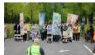
① アバターのパレード