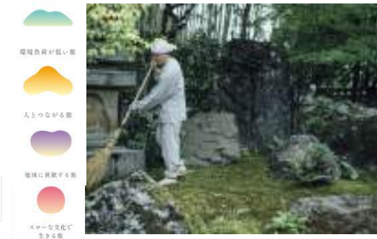
脱炭素を体験できるツアーの様子