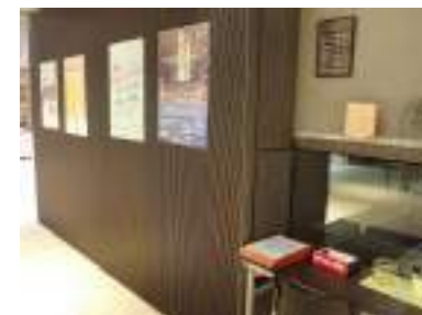
嵯峨美術大学・嵯峨美術短期大学附属博物館 龍谷大学龍谷ミュージアム