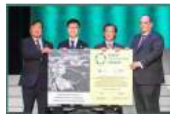
▲ AWARD 表彰式 （令和7年9月7日 IGアリーナ）