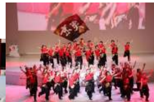
上：京都学生祭典 京炎そでふれ披露 左：京都学生広報部 ウェブサイトコトカレ