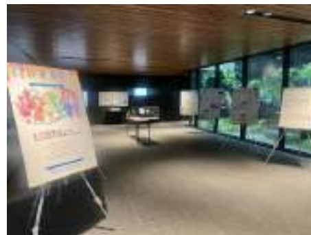
市役所分庁舎 1 階ロビー