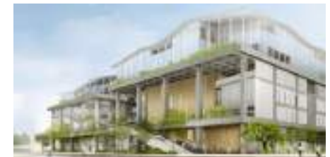
京都市立芸術大学新キャンパス