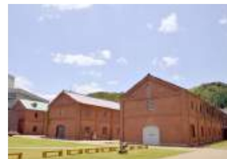
多言語サインの設置