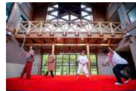
京丹後アートフェスティバル2025 WS成果発表