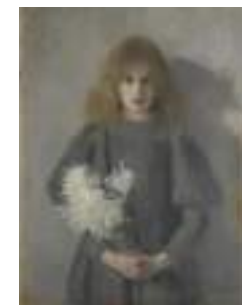
(左) 外観 (右) オルガ・ボズナンスカ《菊を抱く少女》1894年クラクフ国立博物館蔵