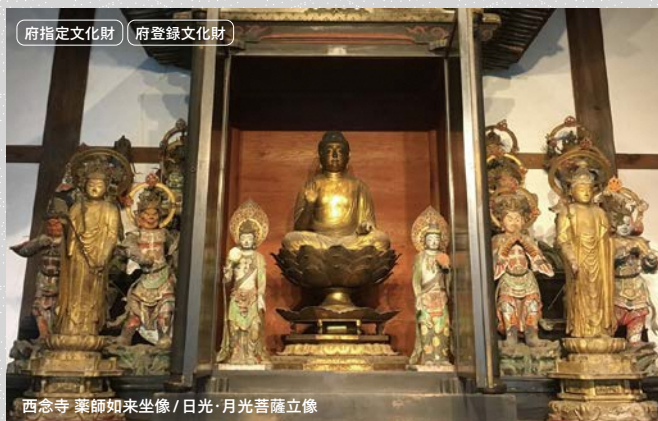
府指定文化財 府登録文化財