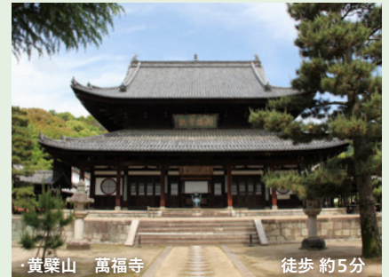
黄檗山 萬福寺 徒歩 約5分