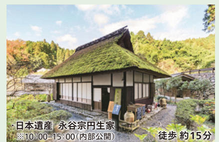
日本遺産 永谷宗円生家 ※10:00-15:00(内部公開) 徒歩 約15分