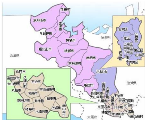
京都府内の行政区界