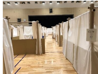
感染症対策に配慮した避難所レイアウト

・被災市町村は、感染症対策に配慮した十分な避難スペースを確保するとともに、適切にレイアウトした避難所を運営する。