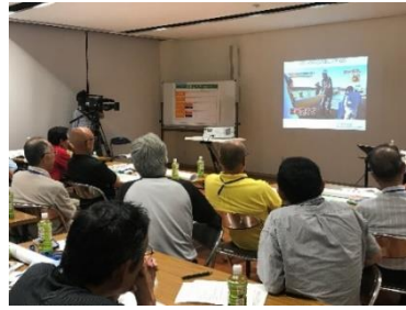
令和元年度住民向け避難行動に関するワークショップ(兵庫県太子町)

・構成団体は、住民が正常性バイアス（自分は災害に遭わないという思い込み）等を認識し、避難行動すべきタイミングに適切な避難行動がとれるよう普及啓発を図る。