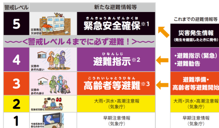
新たな避難情報等と警戒レベル