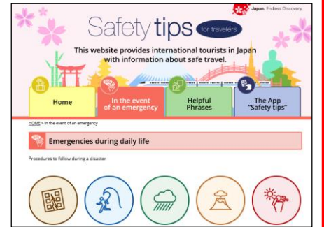
Safety tips ホームページ画面(啓発カードのリンク先)