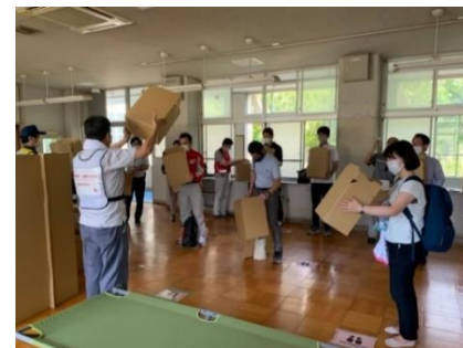
令和2年度避難所開設・運営訓練（堺市）

・広域連合が構成団体及び連携県とともに実施する広域応援訓練において、感染症対策に配慮した避難所開設・運営訓練を積極的に実施する。