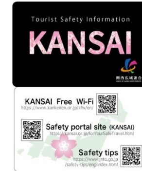
外国人観光客向け啓発カード(上:表面、下:裏面)

・広域連合は、外国人観光客が携帯電話端末等を用いて、QRコードを読みとることで、災害関連情報を入手する方法を周知するための啓発カードの作成・配布により、外国人観光客の円滑な避難を支援する。