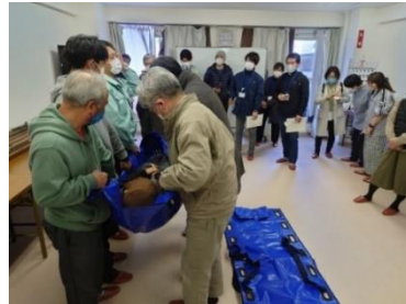
令和2年度避難行動要支援者搬送訓練(兵庫県明石市)

・市町村は、指定避難所内の一般避難スペースでは生活することが困難な障害者等の要配慮者のため、必要に応じて、福祉避難所として指定避難所を指定するよう努める。 ・市町村は、福祉避難所について、受入れを想定していない避難者が避難してくることがないように、必要に応じて、あらかじめ福祉避難所として指定避難所を指定する際に、受入れ対象者（高齢者、障害者等を表記）を特定して公示する。