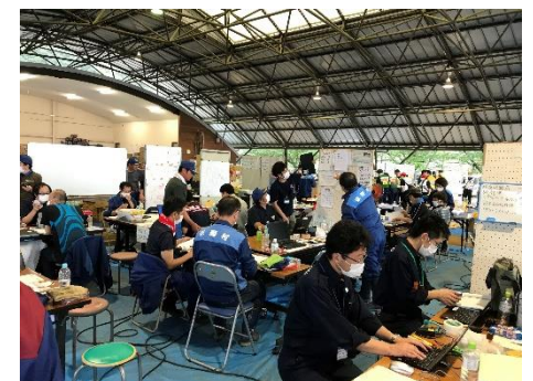
派遣職員の感染症対策（マスク着用・換気）（令和2年7月豪雨（熊本））