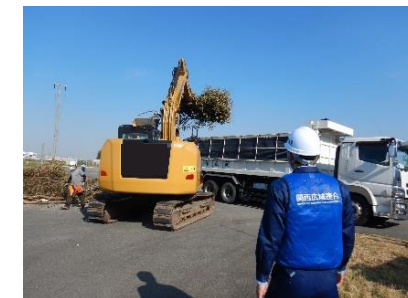
令和2年度関西広域応援訓練(堺泉北港2区 基幹的広域防災拠点)

・広域連合は、ライフライン事業者との間で「大規模広域災害における連携・協力に関する協定」を締結し、平時からの情報共有と大規模広域災害時の連携・協力に向けた体制を構築する。 ・広域連合は、ライフライン事業者や実動機関と連携して訓練を実施し、上記の協定に基づく連携・協力を実効性あるものとする。