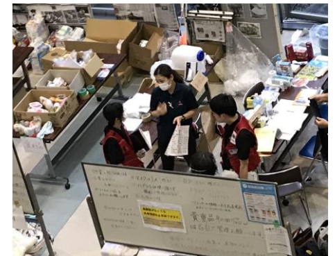
避難所における情報共有（令和2年7月豪雨（熊本））