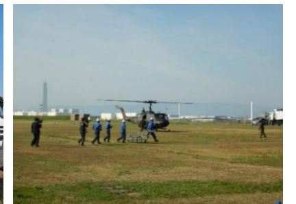
左:倒木除去訓練 右:災害復旧資材の空輸訓練