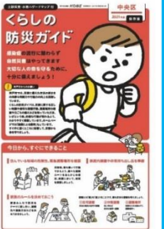
住民向け防災ガイド （神戸市作成）