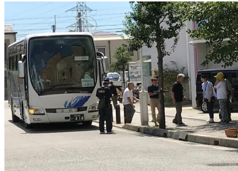
平成30年度原子力総合防災訓練 （福井県高浜町から兵庫県宝塚市への広域避難訓練）