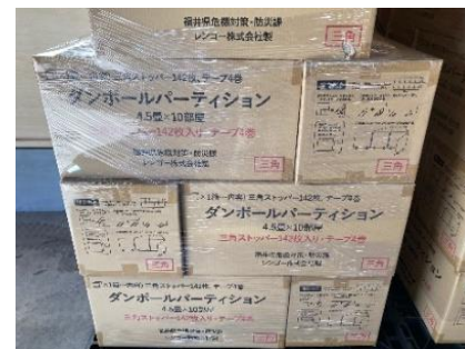
感染症対策資機材の備蓄

・応援府県が調達する救援物資に不足が発生する場合に、広域連合が府県間調整を行う救援物資の例として、マスク、消毒液、パーティション等の感染症対策に必要な物資を追記する。