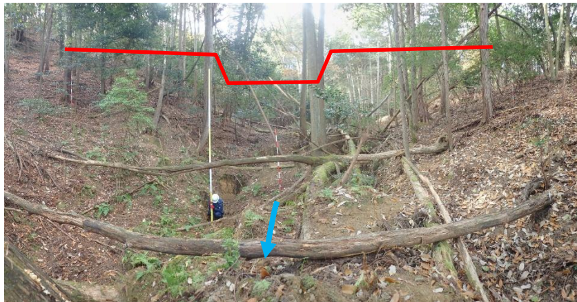
R8治山ダム工 計画箇所