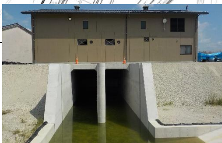
排水機場 【施工状況(R7.8)】