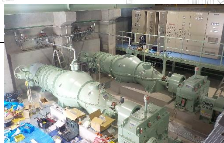
排水ポンプ 【施工状況(R8.5)】