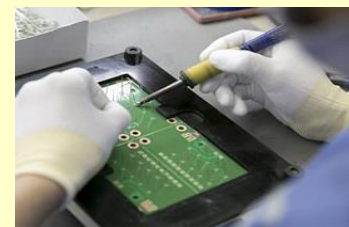
(不足するプリント基板部品)