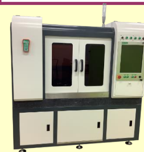
(省エネレーザー加工機)