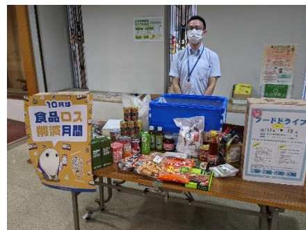
▲フードドライブの様子

昨今、コロナ禍や物価高等で食品を必要とされる方が多い中、フードドライブを行うことはSDGsだけでなく、地域への貢献にもつながります。