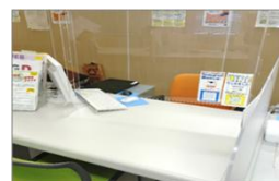
カウンセリングブース