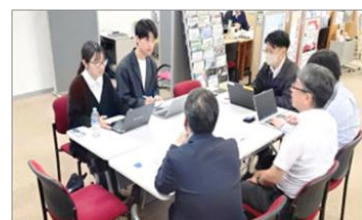
学生交流スペースでの学生と社会人との交流（イメージ）

より幅広い学生の利用を促すため、学びや交流の場として自由に利用できるフリースペースを設置するとともに、企業にとっても学生と直接交流できる場として活用を促進。従来の個別支援等に加え、学生と企業の相互理解を深め、新たなマッチング機会を創出。