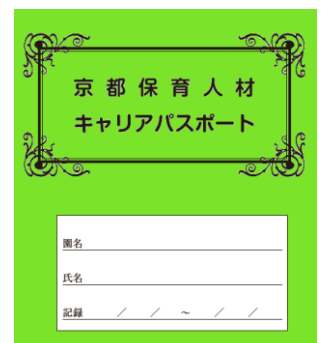
(パスポートイメージ)