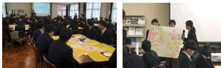
[高校でのグループワークの様子(平成30年度)]

綾部市では、高校生からの意見や提案をあやバスのサービス向上につなげるために、高校生を対象としたあやバスモニター制度を実施する。