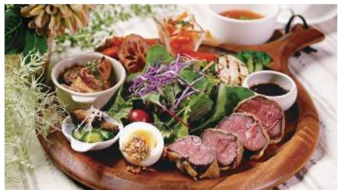
バーベキューアンドカフェ ホノホ 福知山