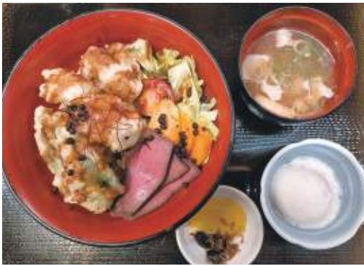
みちのえき「きょうたんばあじむのさと」さとやまれすとらん ポンチ 京丹波