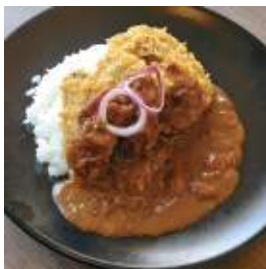
ひとつぶ あやべてん

☎ 0773-48-1000 綾部市位田町松前81 ¥ 1,500円 休火 有 🕒 10:00~17:00(LO 16:30)