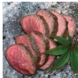
やなぎまち 福知山