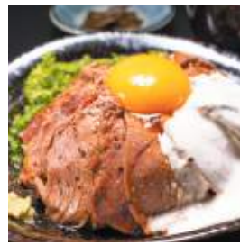
みちのえき「なごみ」 京丹波