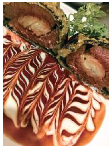
しかとわいん たんぱ克蘭コ 福知山