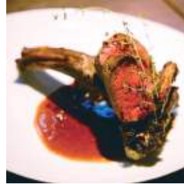
ビストロ キュー 福知山