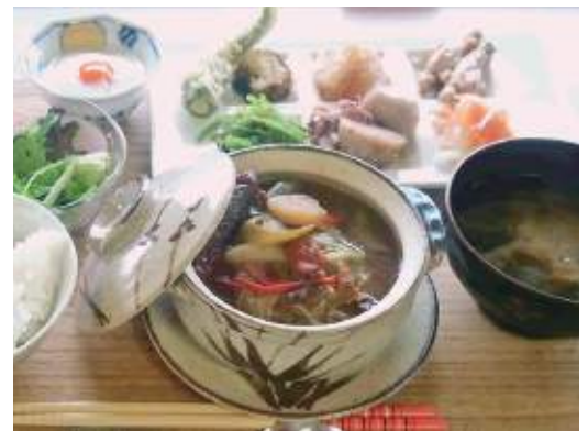
おうちごはん「ゆうりか」