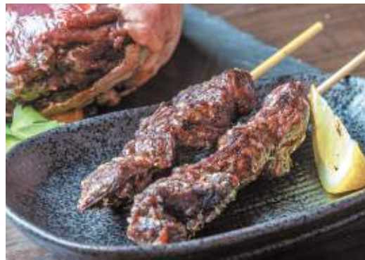
すみいざかや だんじょう