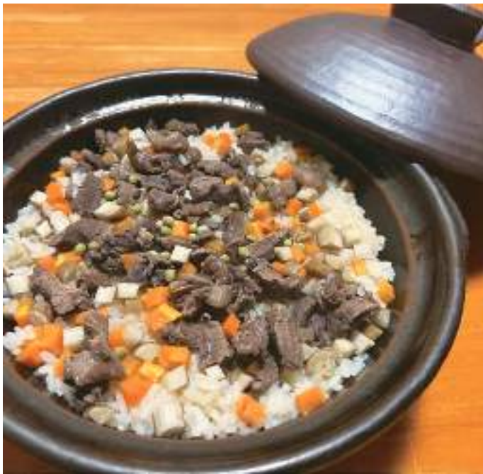
ぎよさいしゅぼう あずき