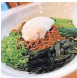
しるなしたんたんめん とがし