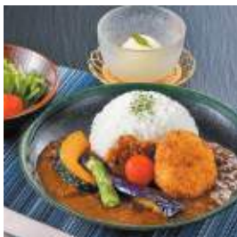
にほんりょうり いちえん 福知山