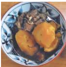
せいにく・ししにく・しかにくのみせ はま