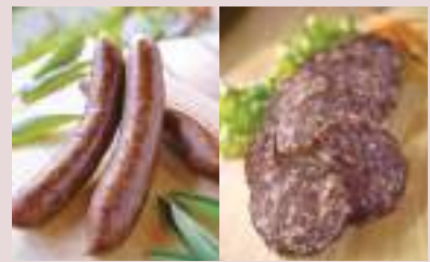
みやまおもしろのうみんくらぶ