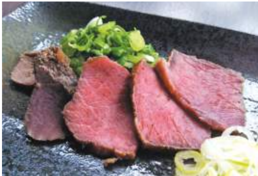
くもはら おおえやま おにそばや 福知山