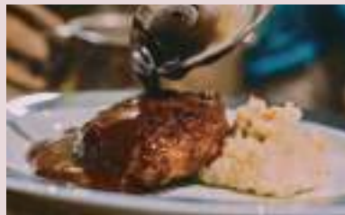
しかにくのかきうち