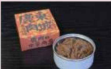
じつとく (かんざんじつとく)