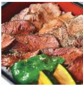
あやべふれあいほくじょう はいじのきっちん