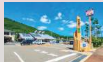
みちのえき うっていーけいほく