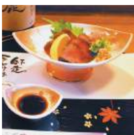
たべどころのみどころ たんばちや 福知山