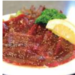
やきにく亭 かどや 福知山