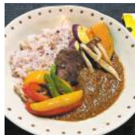
やくぜんかふえ あんど りふれっしゅさろん ソルテ 福知山