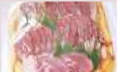
せいにく・ししにく・しかにくのみせ はま