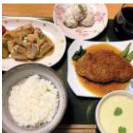
のうかみんしゆく ひでじろう 福知山