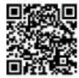
▲「犯罪・交通事故情報マップ」