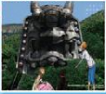
※イラストはイメージです