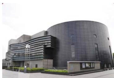
※ 京都コンサートホール