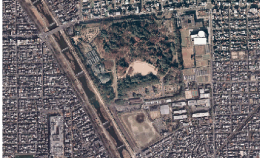
※ 北山地域の航空写真

※ 本報告書において「北山地域」とは、特にことわりのない限り、賀茂川、北山通、下鴨中通、府立大学南側通に囲まれた地域を指す。