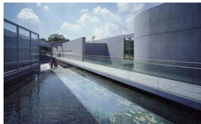
※ 京都府立陶板名画の庭