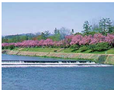
※ 賀茂川からの北山地域の風景