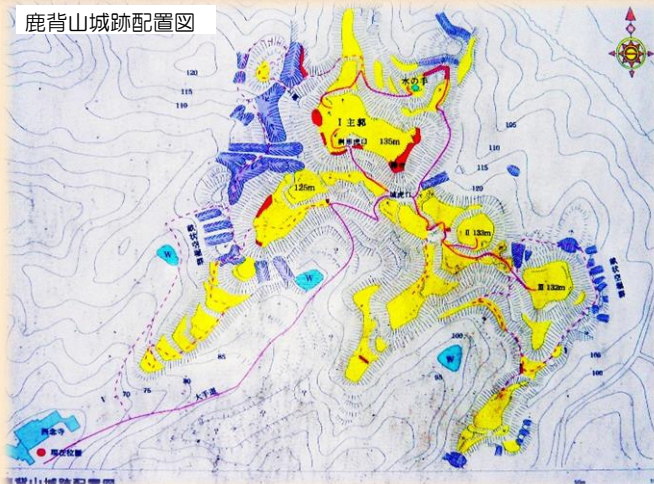
鹿背山城跡配置図