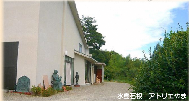
水島石根 アトリエやま