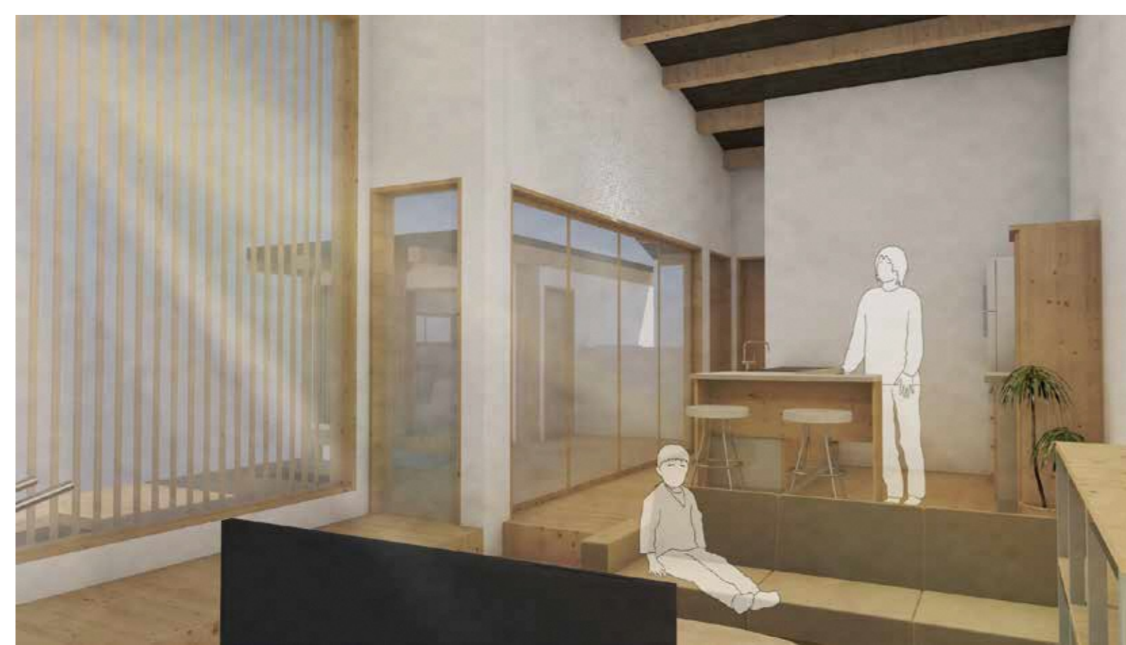
仕切り 部屋を柔らかく区切り、落ち着く場所に