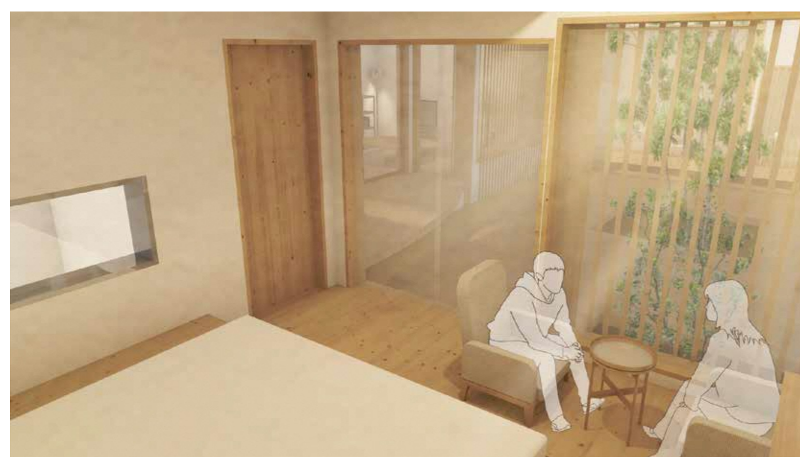
広縁 夫婦がほっと一息つける場所に