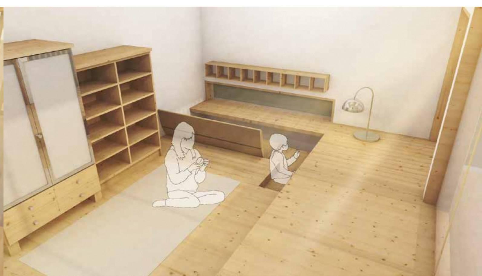
机 遊び場と区切りすぎず、楽しく学べる場所に