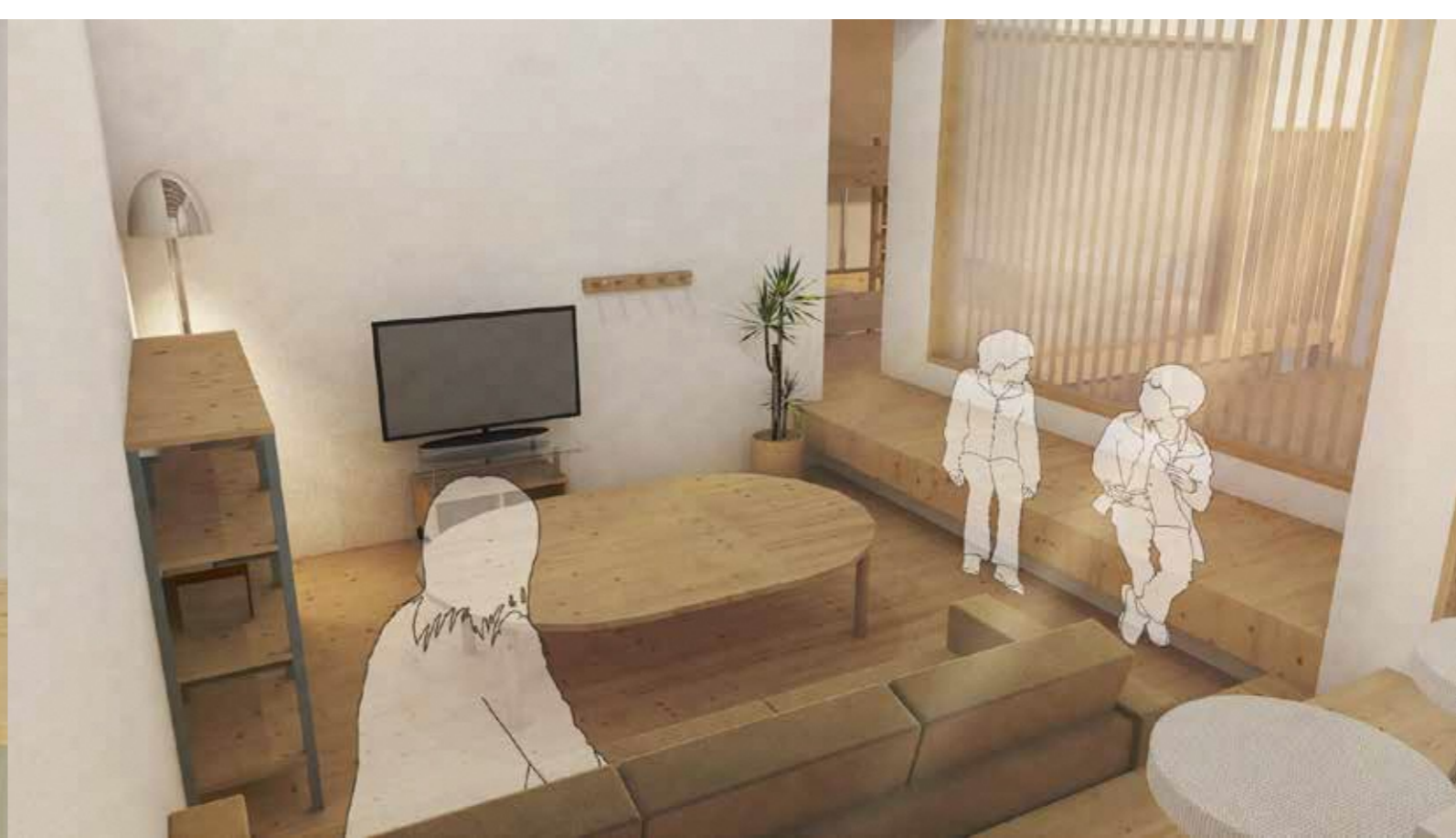
椅子 自由に腰掛けられる、団樂の場所に