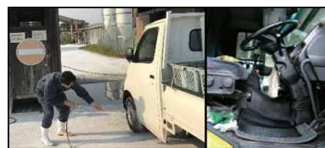
車両はタイヤだけでなく、 泥よけの内側まで消毒 し、 フロアマットの交換やペダル等車内も消毒