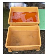
推奨される踏込消毒槽の設置方法！