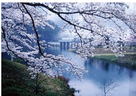
京都府景観資産「大野ダムが形づくる水辺景観」