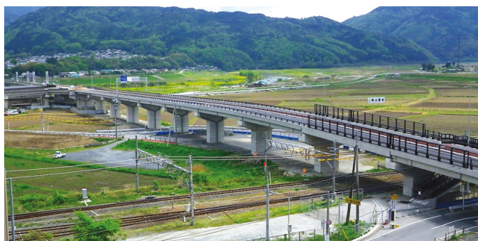
亀岡園部線(保津南工区)

◇計画的な予防補修の実施により施設の長寿命化を図り、維持管理・更新費全体のコストを縮減させる等、アセット・マネジメントを推進します。