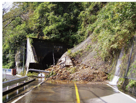
綾部宮島線 (平成16年台風23号による被災状況)