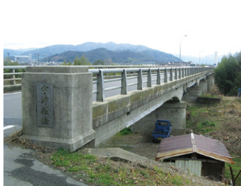
郷ノ口余部線(宇津根橋)の現状