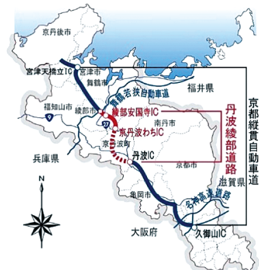
高速道路の整備状況