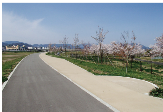
保津川まちづくり計画「保津川花回廊」