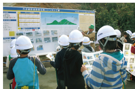
小学生を対象にした工事見学会 (教育と土木のコラボ事業)