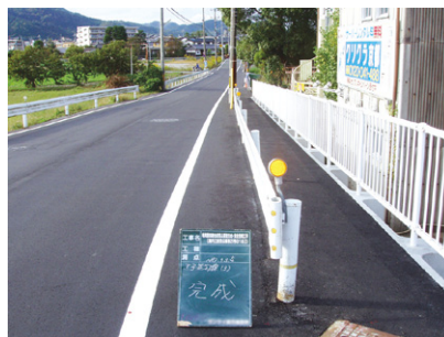
府民公募型整備事業