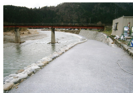
美山川・やすらぎの川づくり