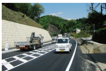
国道 372 号(湯の花工区)