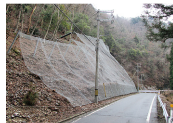
京都広河原美山線(南丹市美山町白石)