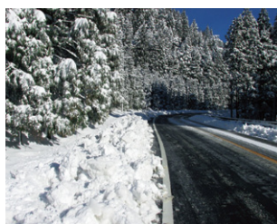
国道 162 号(南丹市美山町盛郷)