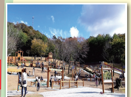
わくわくアスレチックパーク