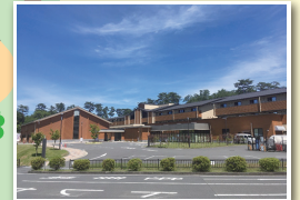
京都トレーニングセンター