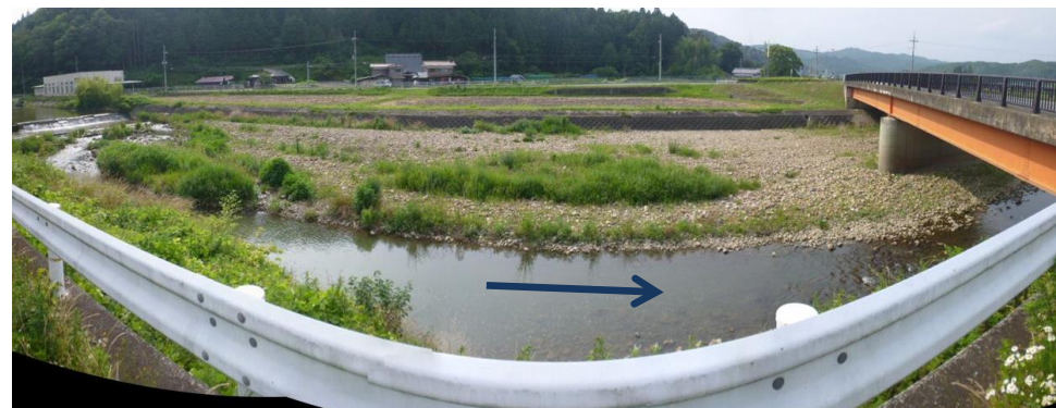
大西橋から上流を望む