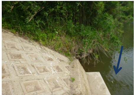
竹の繁茂等が見られる