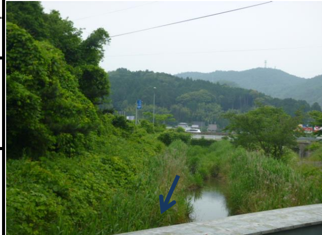
提案範囲を下流から望む 府道から上流を望む