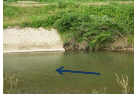
提案箇所アップ写真