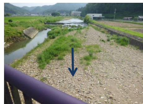
大西橋下流左岸から提案箇所を望む