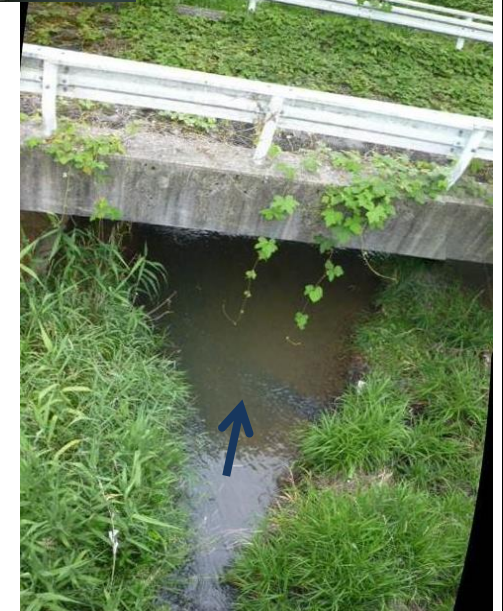
提案範囲を上流から望む